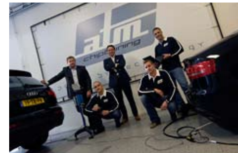
Het team van ATM Chiptuning.